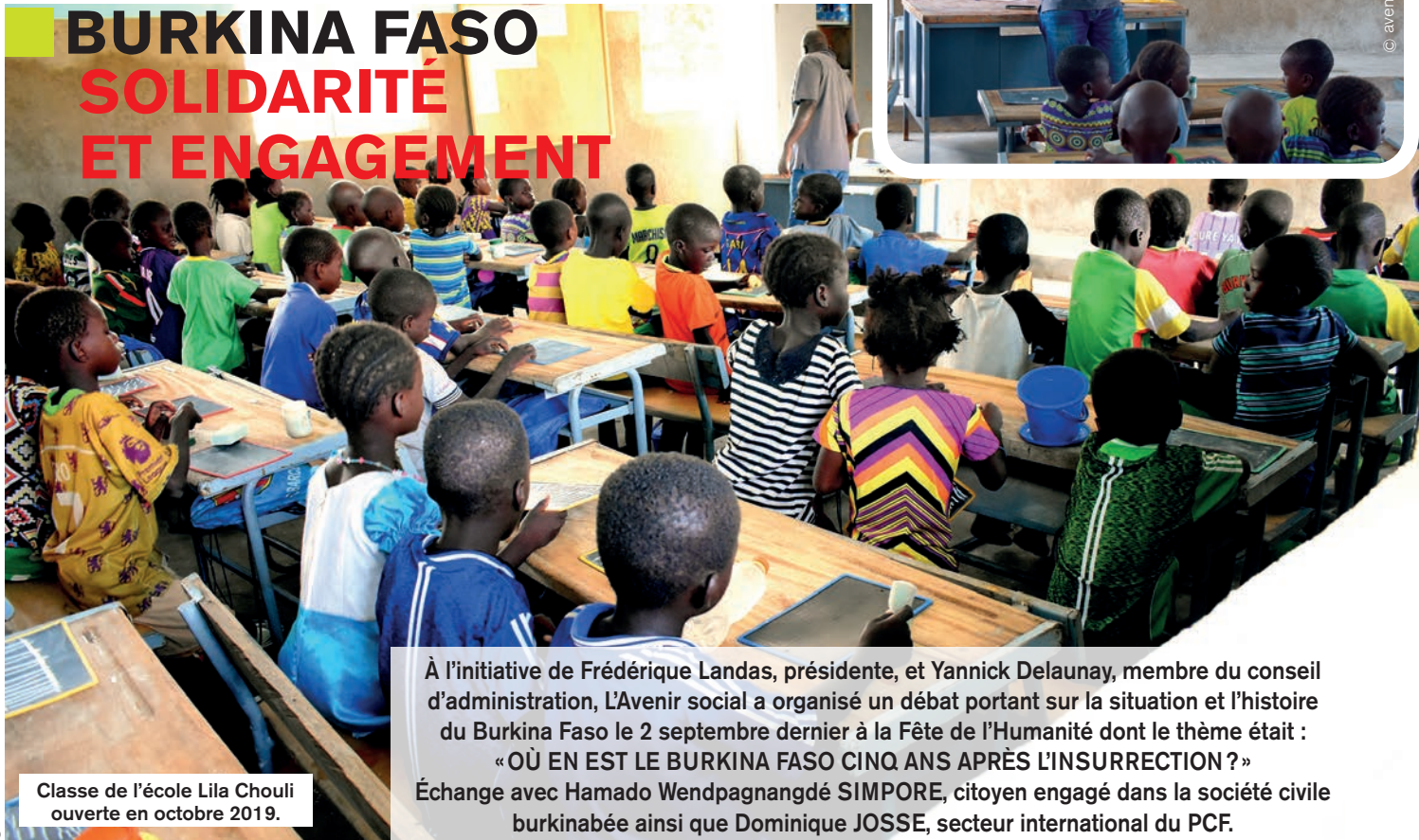
Classe de l'école Lila Chouli ouverte en octobre 2019.